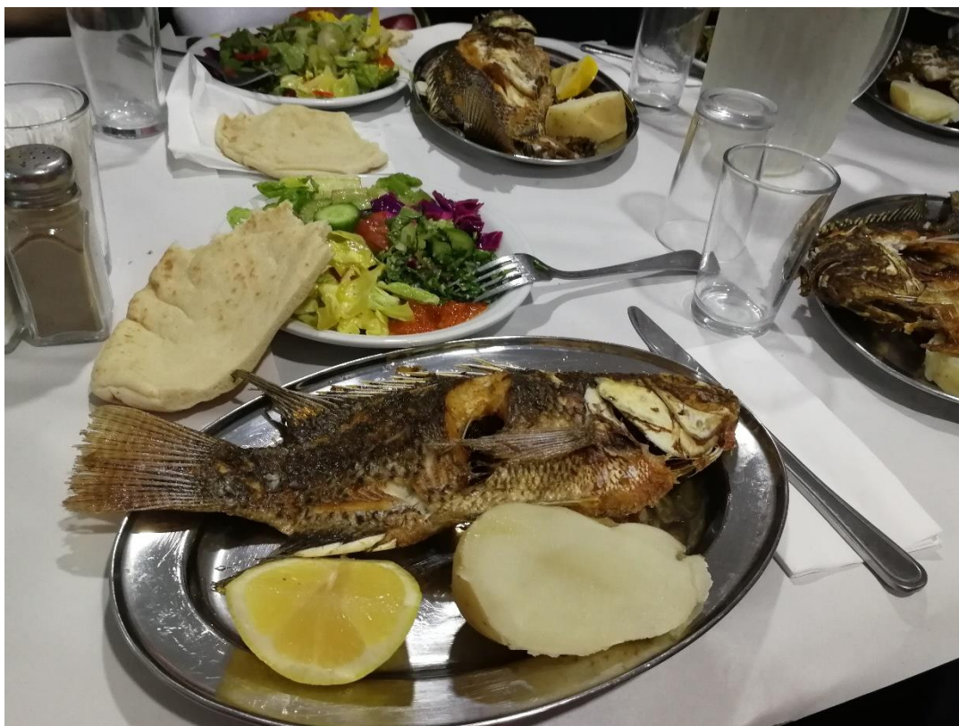
Na obed sme sa zastavili v jednej reštaurácii blízko pri pobreží jazera a dali sme si typickú miestnu pochúťku – rybu svätého Petra.