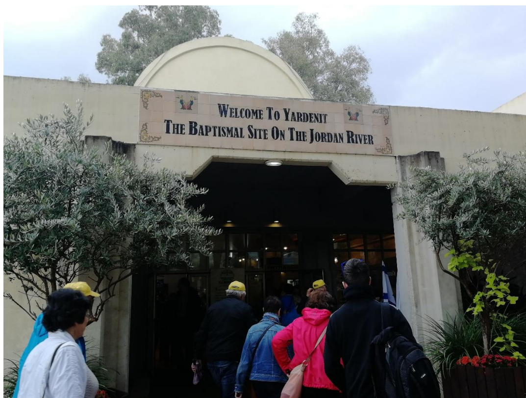
Na záver sme sa zastavili na mieste Jardenit, kde sa krstí v rieke Jordán. Lokalita stojí na mieste, kde rieka Jordán opúšťa Galilejské jazero a pokračuje na juh k Mŕtvemu moru. Tu sme obnovili naše krstné sľuby.